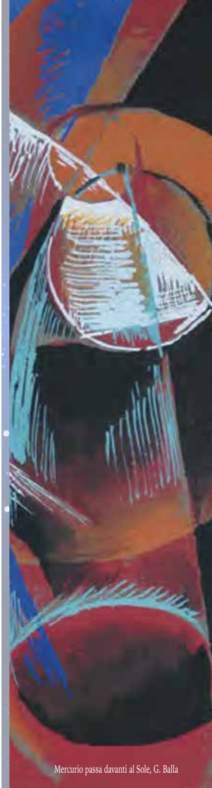
Mercurio passa davanti al Sole, G. Balla